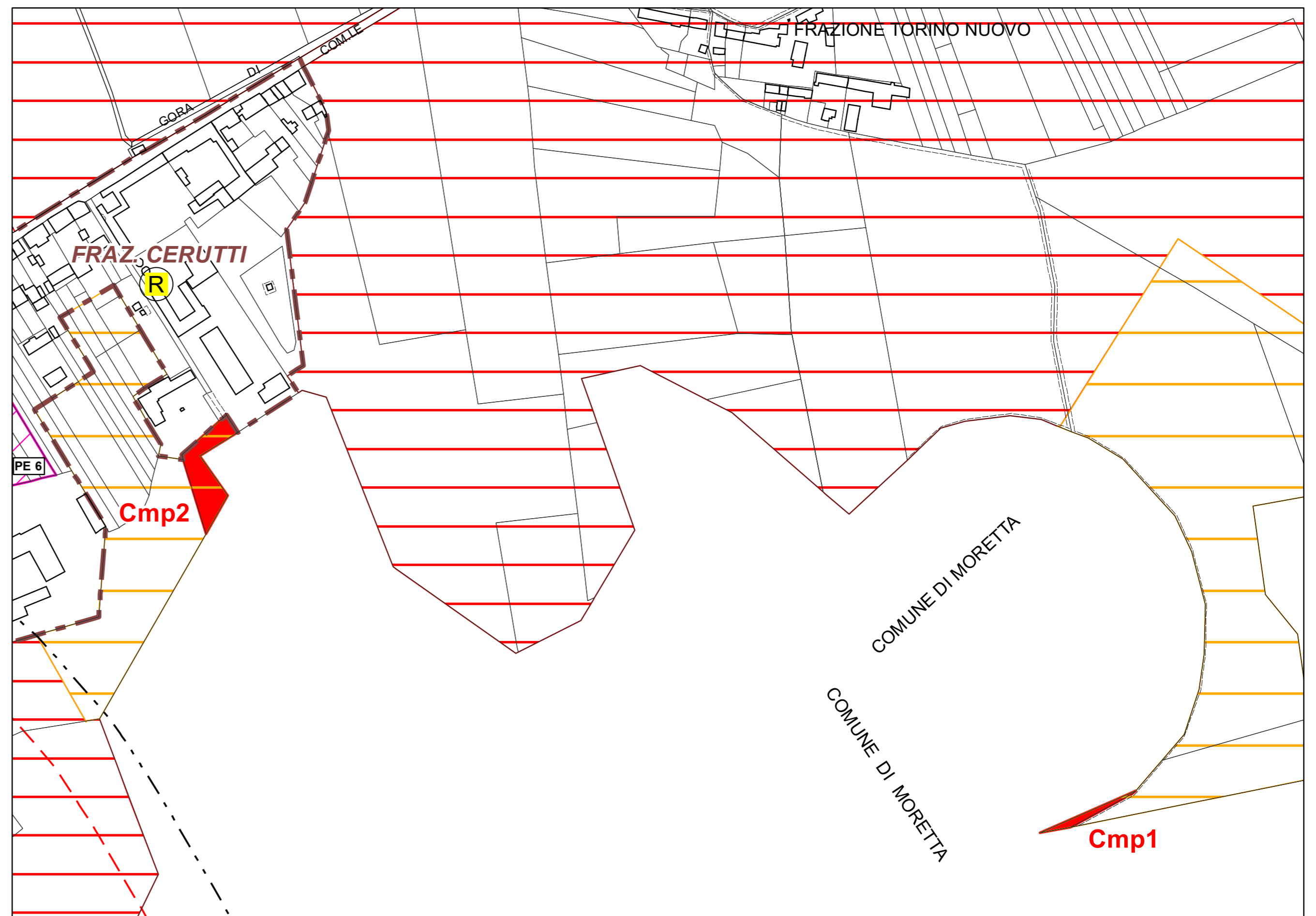
Planimetria di dettaglio zone di compensazione "Cmp1" e "Cmp2"

N.B. Risultano essere riconosciute quali zone di compensazione ambientale, benché non individuate graficamente, anche i sentieri naturalistici Parco del Monviso, sentieri ciclo-pedonali sponde del Po, come precisato dal parere dell'Organo Tecnico Comunale, redatto al termine della procedura di verifica preventiva di assoggettabilità alla VAS della variante parziale n. 33 ed approvato con successiva determina nel mese di luglio 2017