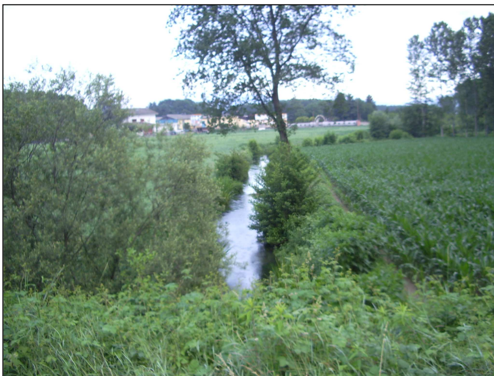
Figura 1 - Murello, rivo Follia