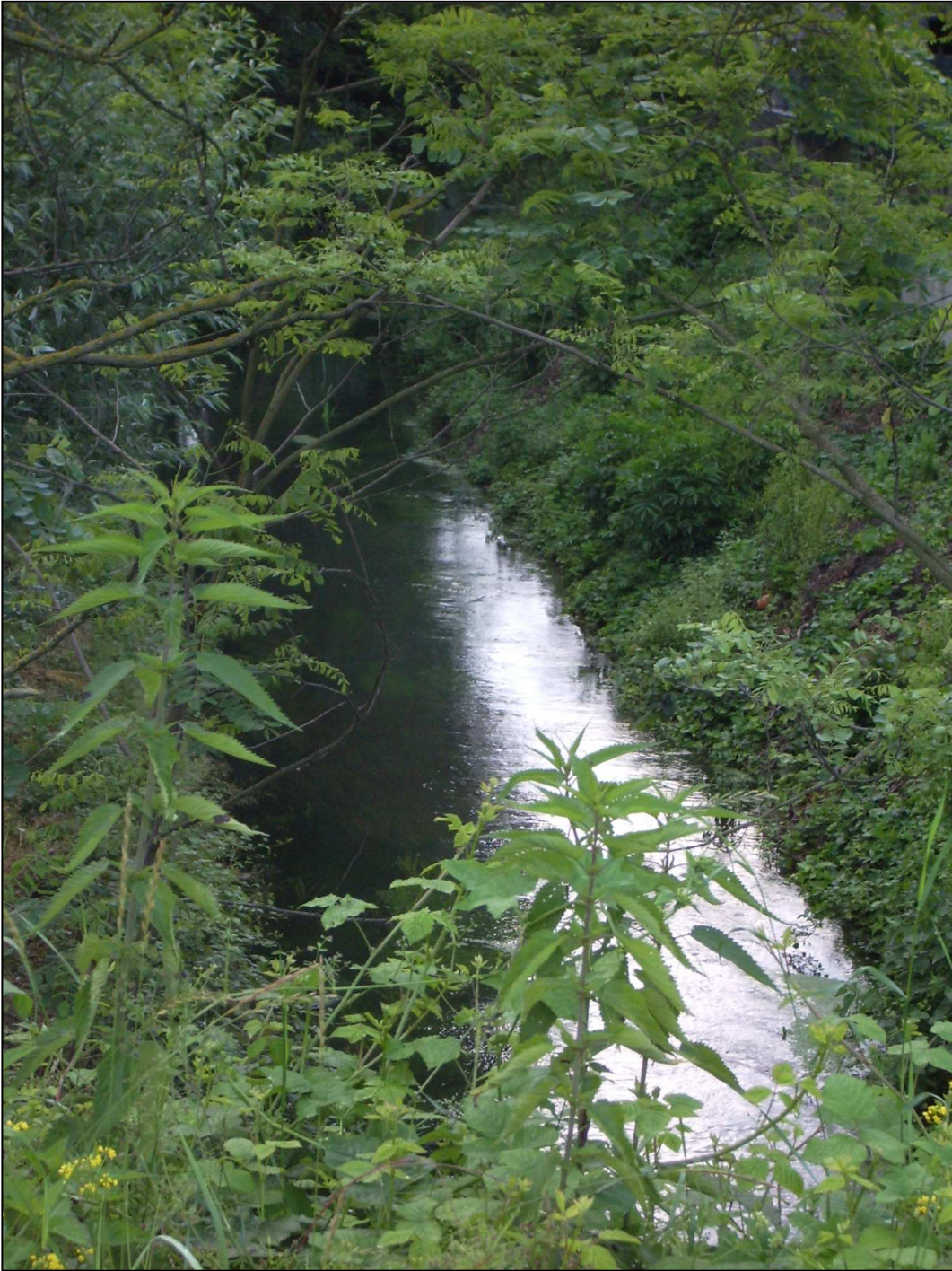
Figura 2 - Murello, rivo Follia