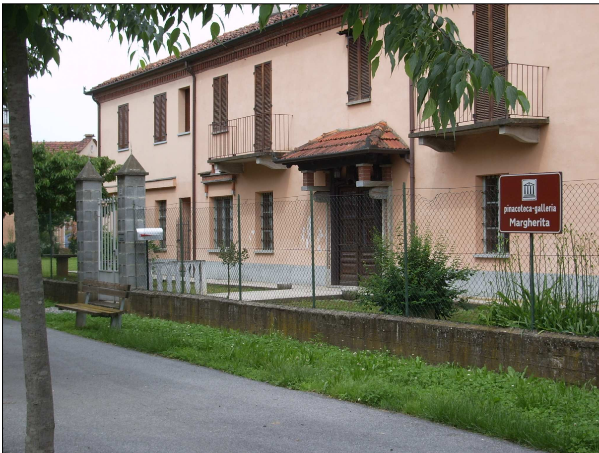
Figura 2 - Villafranca P.te, attuale sede della Pinacoteca-galleria "Margherita"

L'intervento è coerente con principi e obiettivi di competitività indicati dagli strumenti di indirizzo pianificatorio sovracomunali.